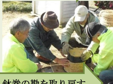
鉢巻の勘を取り戻す