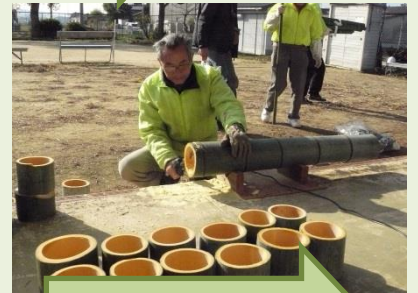
ミニ松飾デビュー