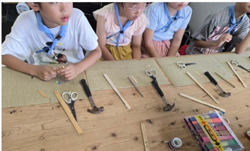
作製前の様子。真剣に説明を聞いてくれています。