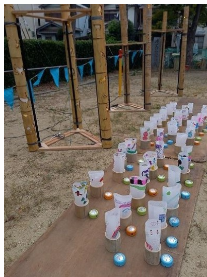
たけくらぶは 3本1 セットの竹あかりを4基 設置しました。