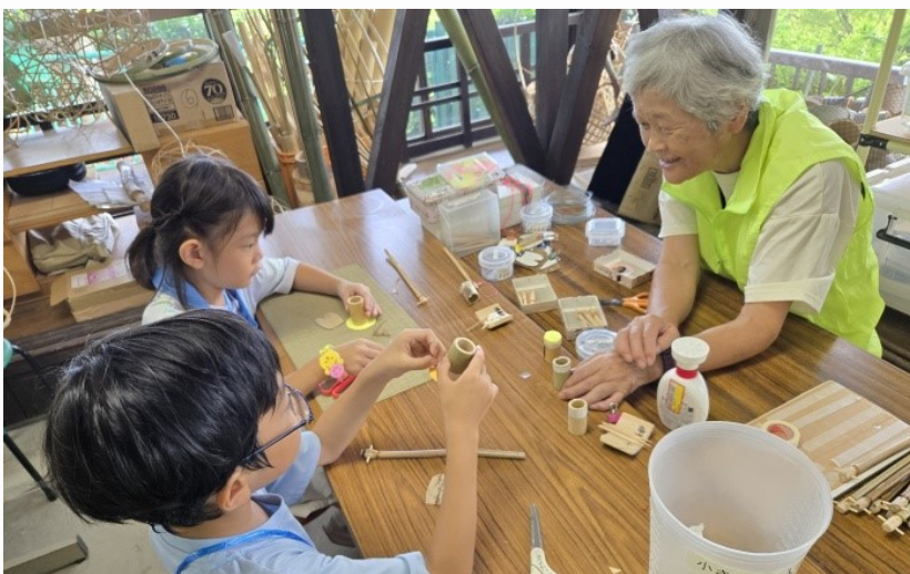
「ブンブンゼミ」作製の様子。

ガリガリトンボ・ブンブンゼミは、完成品の販売もしていますが子供たちに大人気の定番商品です。自分で作った動くおもちゃは、良い思い出になることでしょう。