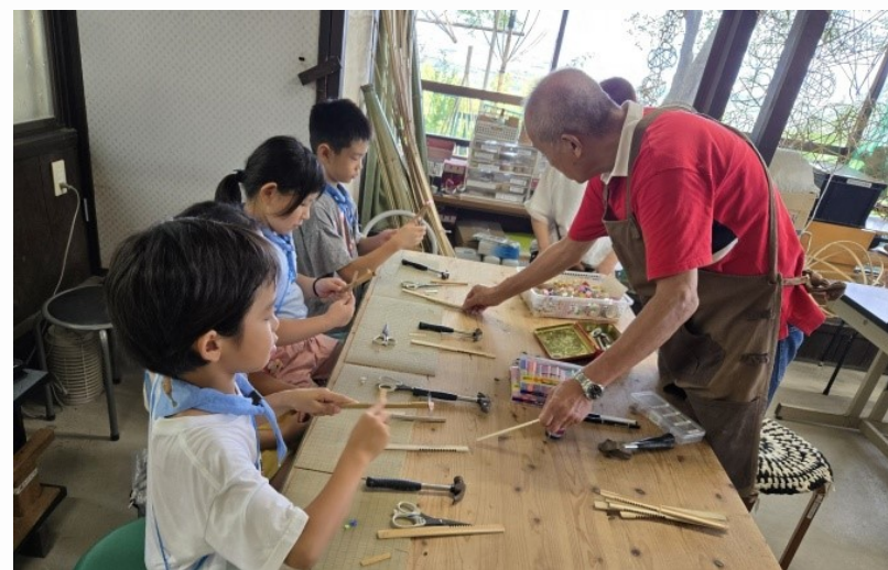
「ガリガリトンボ」作製の様子。