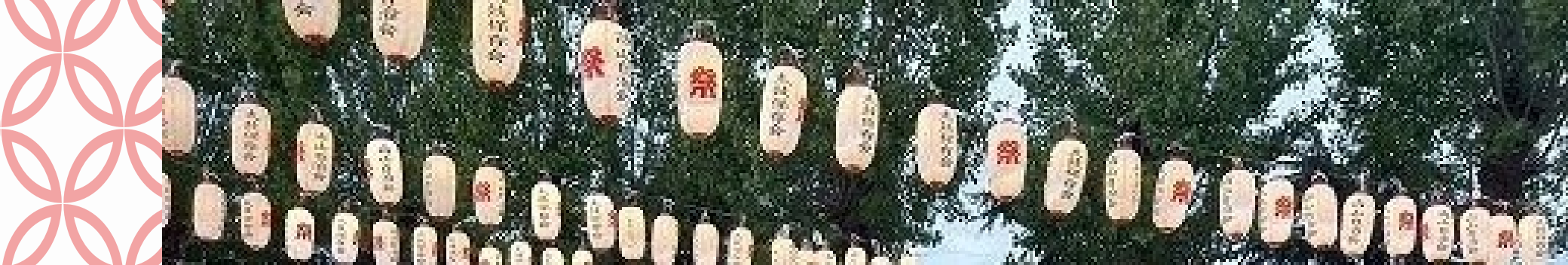
八幡市南山自治会 みなみやま祭り