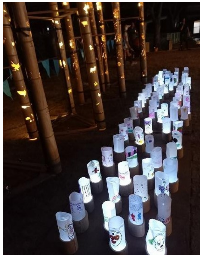
竹あかりと子供たちが作った竹灯籠。