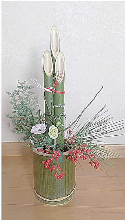
ミニ若竹飾り (高さ40cm)